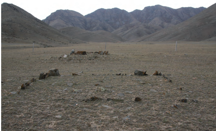
图八 托斯呼尔图1号岩画西墓群中的石围墓