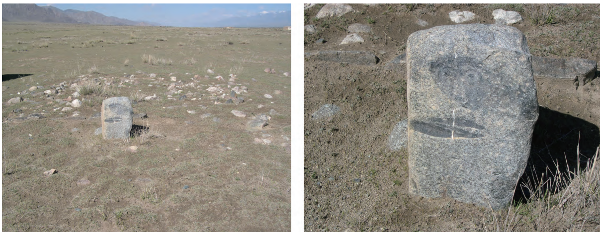
图一三 布热村2号石人墓