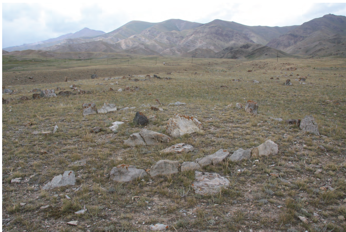
图六 鄂托克赛 10 墓群的方形或长方形石围墓

这一类墓葬并无实地调查材料，但从征集到的石人造型可以确定为典型的切木尔切克文化的石人（图五） ② ，即王博划分的喀依纳尔类型 ③ 。这件石人是由当时在博尔塔拉蒙古自治州博物馆工作的柯希巴特 ④ ，在 2010 年 6 月从牧民家中征集到的。从这件石人的发现可以断定，温泉县应该有切木尔切克文化的墓葬存在，