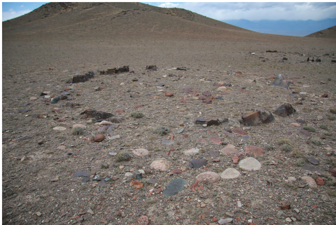
图一 安格里格镇饲料组安赛敖包东墓群 2

代墓葬。这些古代墓葬的发现无疑为温泉县的文物保护和考古研究提供了重要的资料。与新疆其他地区特别是北疆地区相似,这批调查记