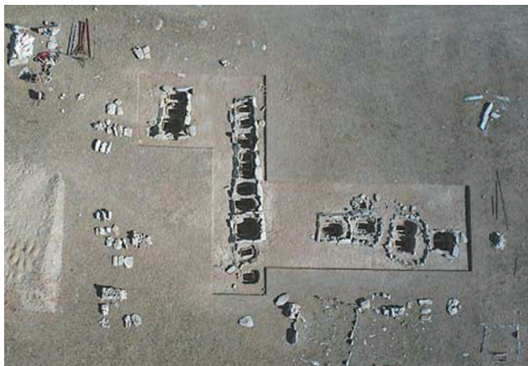
图一〇 阿敦乔鲁晚期的小型石围墓