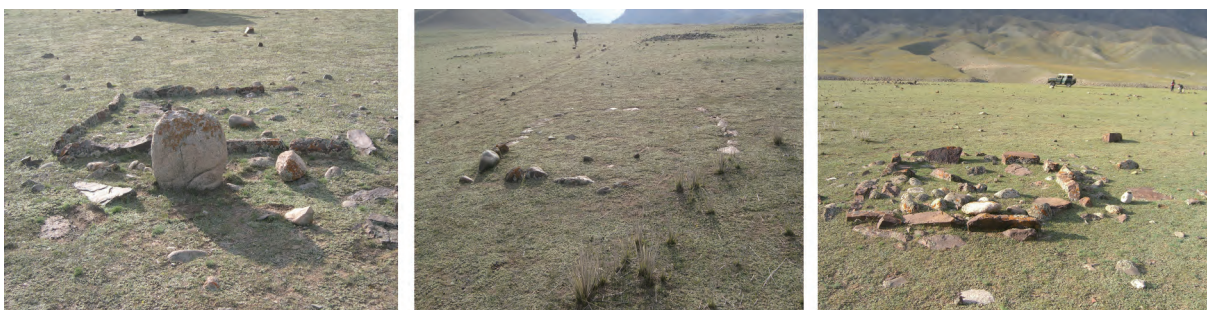
图一四 鄂托克赛检查站西南墓群的小石人墓