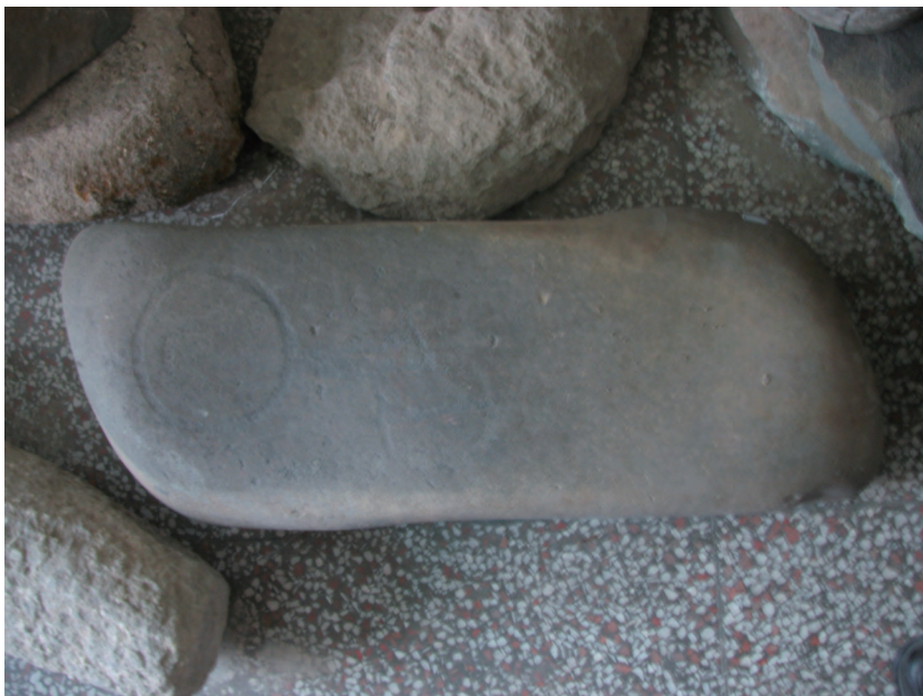
图一七 奥洛尔舍力墓群采集到的鹿石

文化的年代，一般认为是在公元前 13—前 7 世纪，即青铜时代晚期至早期铁器时代 ⑧ 。