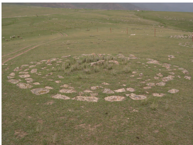
图一一 布呼乌苏墓群之一（中央的石棺）