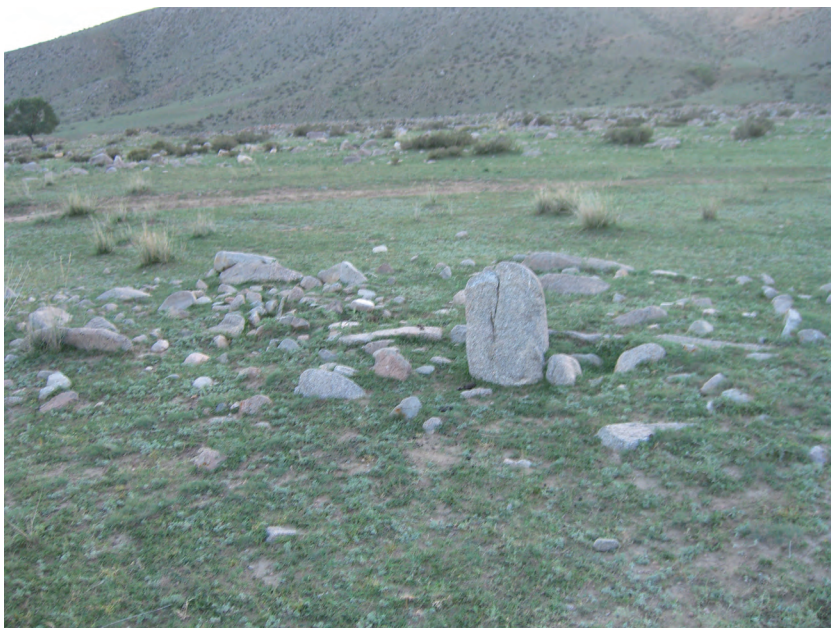
图一六 乌拉斯台石人墓