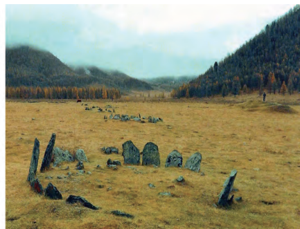
图四 阿凡纳谢沃的圆形石围墓葬