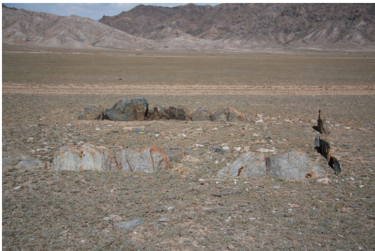
图九 托斯呼尔图3号墓群的石围墓

但其墓葬形制究竟什么样,地表遗迹如何,是否与阿勒泰地区的同类墓葬相似,目前还一无所知,希望在今后的工作中予以重视,尽早找到温泉县的切木尔切克文化遗存。