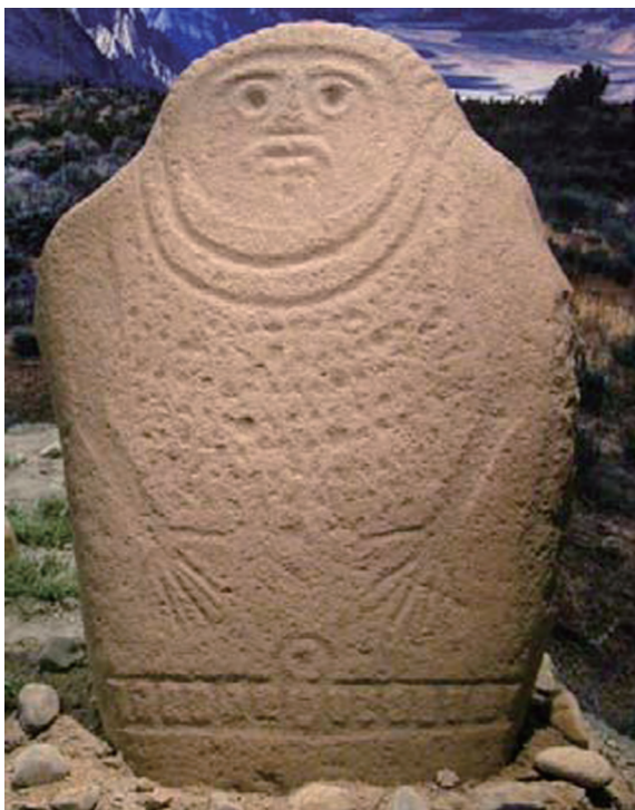
图五 温泉县发现的石人（现藏于博尔塔拉州博物馆）

七河流域及博尔塔拉河流域与安德罗诺沃文化联合体有关联的墓葬几乎全部是方形或近方形石围，无封堆，所以，这种近圆形石围墓很难