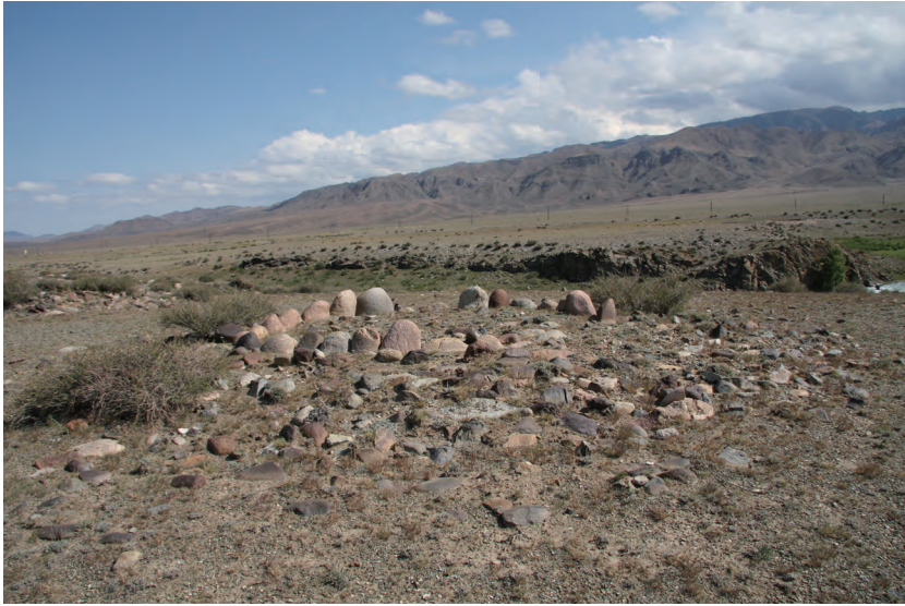
图二 鄂托克赛河北岸2号墓群