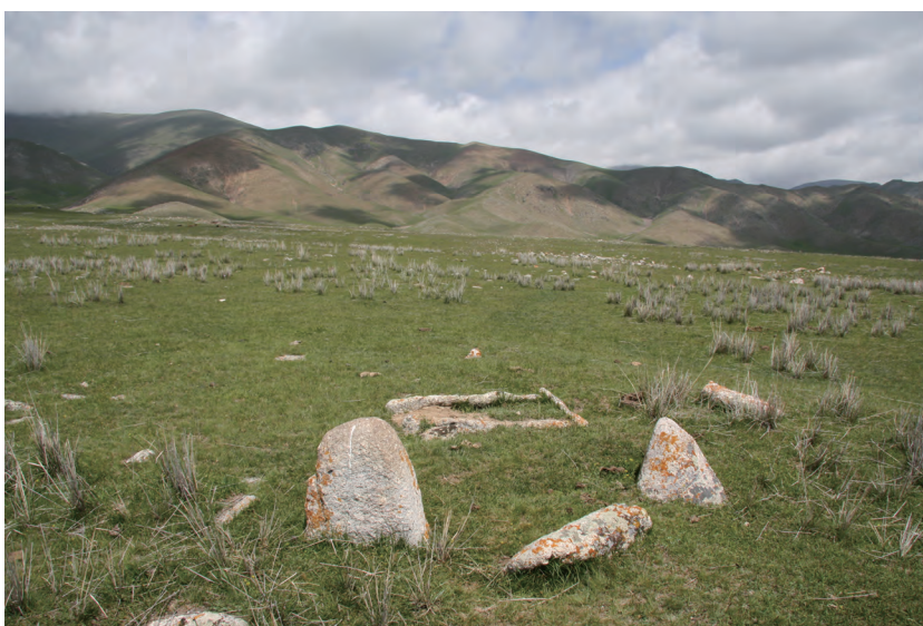
图一五 沙雷比留克石人墓

五)、乌拉斯台石人墓(图一六)也属此类。这种小石人墓的年代也没有发掘的资料可以对比,就目前来看,这种小石人区别于切木尔切克文化的石人,也不同于后来的突厥时期石人,