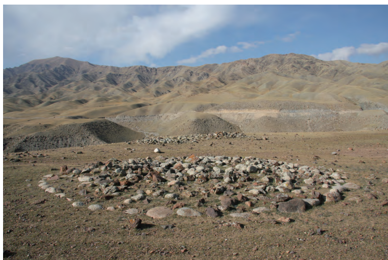
图一二 鄂托克赛检查站西南1号墓群

头平铺在地表平面上，形成一个圆形或近似圆形的墓葬。像布呼乌苏墓群中的墓葬（图一一）和鄂托克赛检查站西南1号墓群（图一二）里都有此类墓葬。另外，还有些类似但似乎被破坏而留下的不规则的平铺的石砌墓也应归于此类。由于该类墓葬的石块是平铺在地面上的，所以，往往在中央部分会露出石棺。目前，对这类墓葬的发掘十分有限，仅见阿敦乔鲁一例，编号为M1。阿敦乔鲁M1是一圆形平铺的石砌墓葬，中央是几乎建在地表上的石棺，石棺中有二次葬的人骨。人骨的碳同位素AMS测定其年代为距今 3253 \pm 27 年，经Oxcal校正后为1605BC—1581BC，即公元前17至前16世纪。当然，不能排除此类墓葬还有其他年代的可能，但至少目前已知的资料证明，该类墓葬的年代上限可到青铜时代的晚期。温泉县境内存在一定数量的此类墓葬，但目前在各地区的考古调查中几乎不见对该类墓葬的报道，这很有可能是将此类墓统统归入了石堆墓。我们建议应区别对待，因为其显著的特点不同于上述的石堆墓，而这些不同很可能代表了不同文化性质和年代。