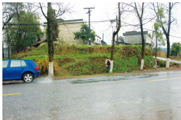
图四 芦南公路旁高于地表的古城墙体断面 (照片显示城墙上建有民房)