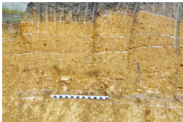
图二 芦溪古城东段剖面细部 (深灰色薄层为建城前古地面,下部黄土为生土)