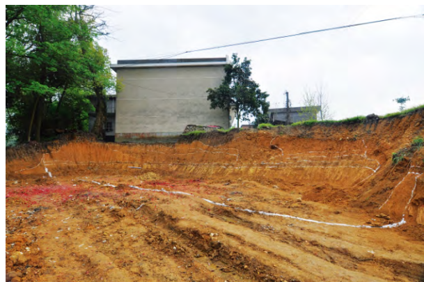
图一 芦溪古城东段剖面 (深灰色薄层为建城前古地面,下部黄土为生土)

环形土垣的西北方向另有一处单独存在的台地,面积万余平方米。此台地与土垣所在的环形台地相距离约40