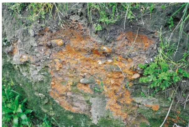
图五 古城北段墙体内部结构 (显示墙系用黄土夹砾石、砂石堆筑)