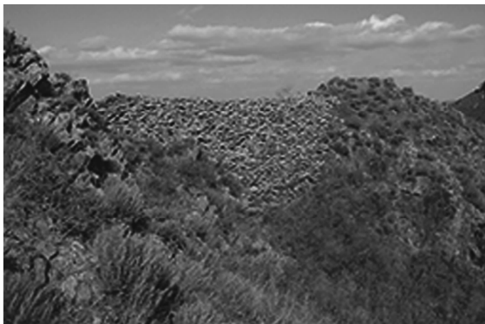
图五 辽祖陵北山石墙 Q25