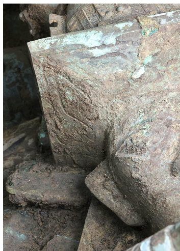
图二 冠面上的眼形类纹饰