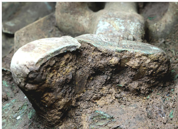
图五 顶尊铜人像腿部断裂处