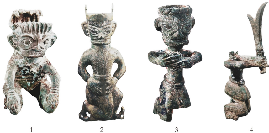
图一 三星堆出土跪姿铜人组图

由过去发现的那件小型铜顶鼎人像看来，这一件顶尊人下面应当还会有个底座（图四），不会直接跪在地面上（图五）。