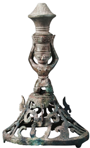
图四 三星堆小顶尊铜人(K2 : 48)

这一次3号坑发现的铜顶尊跪坐人像分铜尊与人像上下两部分，两部分为分别铸造后焊接为一体，发掘者在铜尊圈足与铜人冠顶之间观察到明显焊接痕迹。 [8]