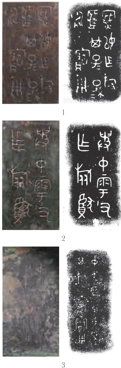
图一二 出土铜器的“密” 1. 密姁鼎铭 2. 𠄎仲零父甗 3. 仲大师子匚盨