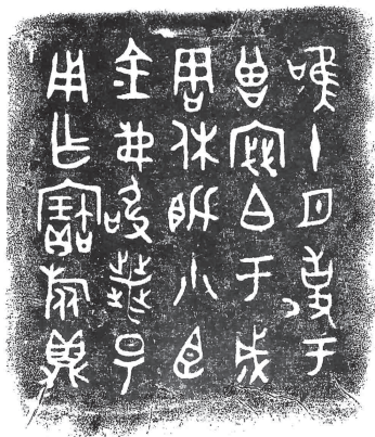
图一一 易鼎铭文中的“密”

甘肃灵台县历年出土“密”“密市”“密亭”陶文（图一三），出土地点“在灵台县东自邵寨镇、西至梁原 60 公里的范围内”，几乎覆盖全境 [25] 。这批陶文，袁仲一、徐在国、后晓荣等人的著作皆失收，其实很重要 [26] 。